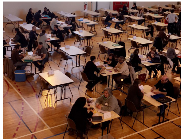
© COR - Forum des rencontres 2016